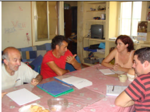
EAE-Cádiz. Acción nº 45 – 21/06/2011