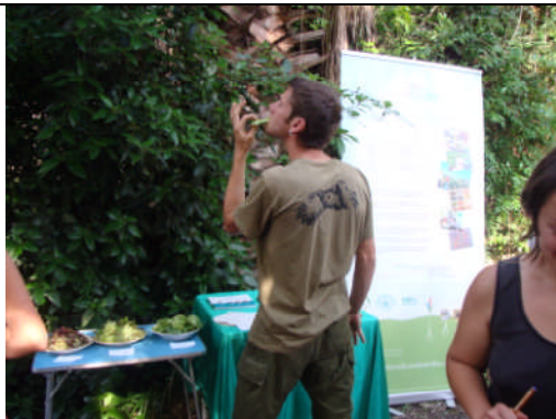
PC-Córdoba. Acción nº 62 – 04/05/2011