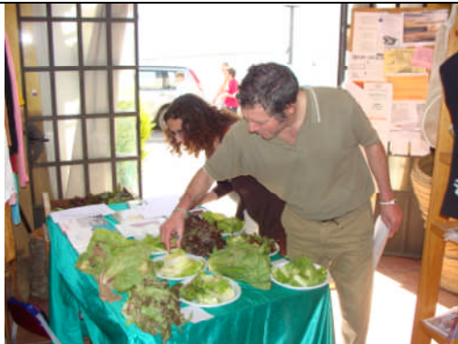
PC-Huelva. Acción nº 50 – 14/04/2011