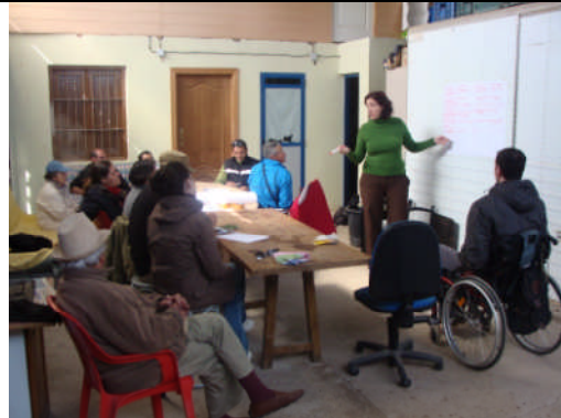
EAE-Almería. Acción nº 29 – 05/03/2011