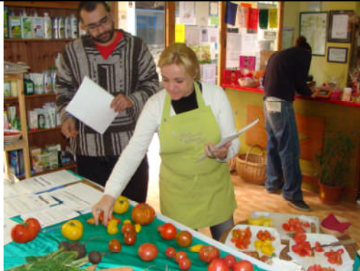
PC-Almería. Acción nº 26 – 04/03/2011