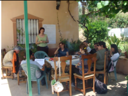
EAE-Córdoba. Acción nº 58 – 05/05/2011