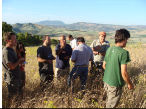
EAE-Málaga II. Acción nº 76 – 17/06/2011