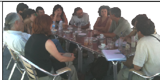
RC-Castilla La Mancha. Acción nº40 – 18/06/2011