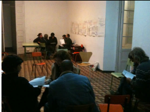
EAE-Málaga. Acción nº 23 – 03/03/2011