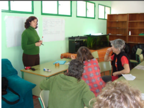
EAE-Jaén. Acción nº 36 – 19/03/2011