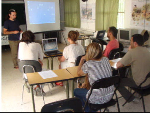
EAE-Sevilla. Acción nº 74 – 01/06/2011