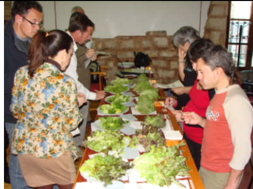
PC-Jaén. Acción nº 34 – 18/03/2011