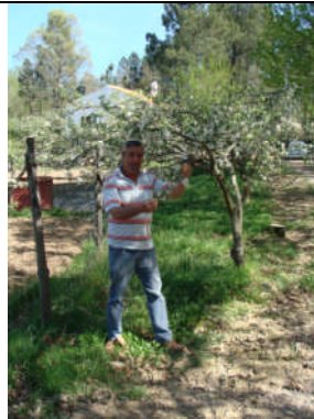
EAE-Huelva. Acción nº 47 – 13/04/2011