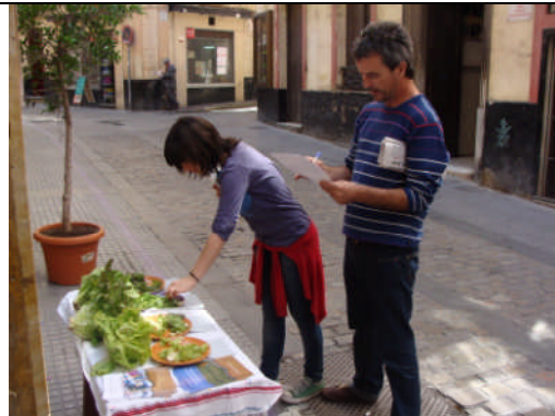
PC-Cádiz. Acción nº 54 – 26/04/2011