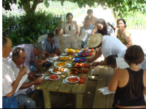
PC-Sevilla. Acción nº 80 – 30/06/2011