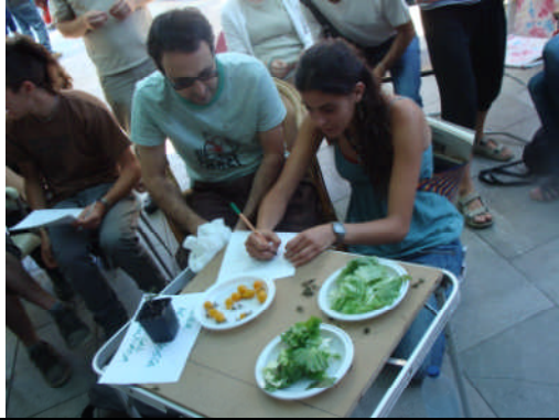
PC-Granada. Acción nº 69 – 31/05/2011