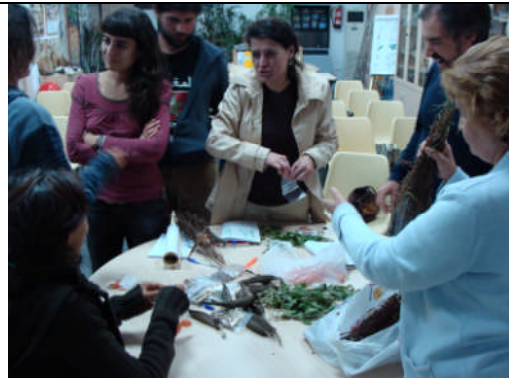
RC-Extremadura. Acción nº 01 – 22/10/2010