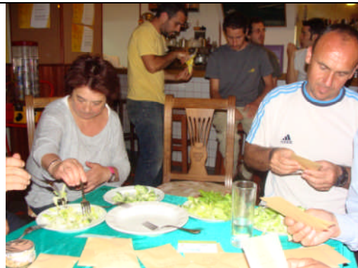
PC-Málaga. Acción nº 66 – 23/05/2011