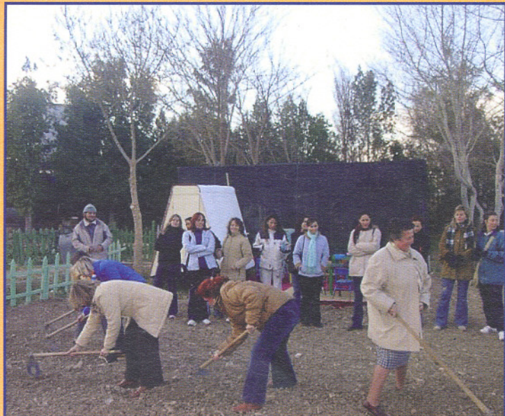
El Centro de Interpretación del Río (en adelante C.I.R.):

Se encuentra ubicado al Norte de la Ciudad de Sevilla, al borde mismo de la Dársena de San Jerónimo. Por su situación y dotación dispone de recursos socioambientales orientados para el ofrecimiento de un espacio abierto de ecología social.