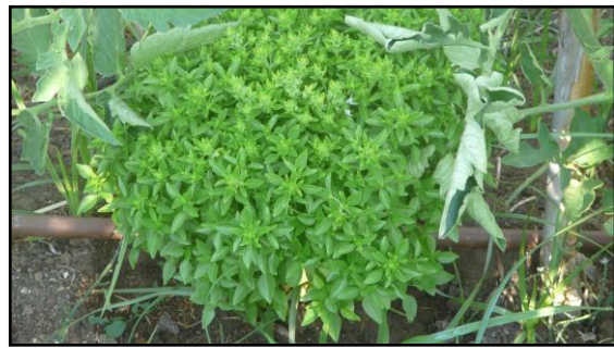
Albahaca “de hoja fina”